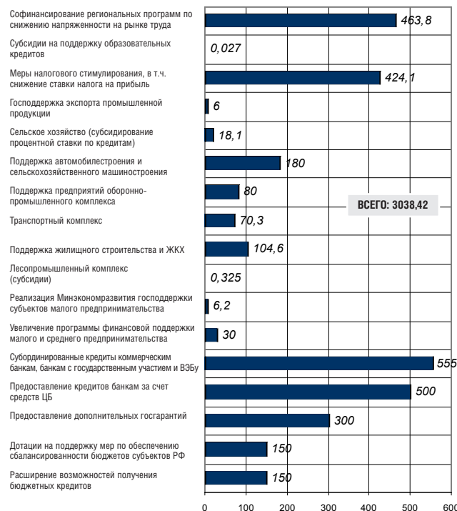
АНТИКРИЗИСНЫЕ МЕРЫ В 2009 Г. (финансирование, млрд. руб.)